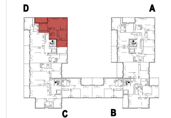
PLAN DE SITUATION NIVEAU R+2

Nota: La configuration précise et le mesurage des lots seront établis ultérieurement. Des modifications sont susceptibles d'être apportées à ce plan en fonction des nécessités techniques de la réalisation tant en ce qui concerne les dimensions libres que les équipements. Les surfaces indiquées et les cotes sont approximatives. Les retombées, poutres, soffites, faux plafonds, canalisations, radiateurs ne sont pas systématiquement représentés. Les indications d'équipements et de plantations ne sont pas contractuelles.